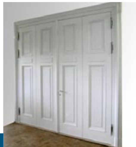
Design des 19. Jhdts., Technik des 21. Jhdts.: Sturm Feuerschutztüren für historische Gebäude.