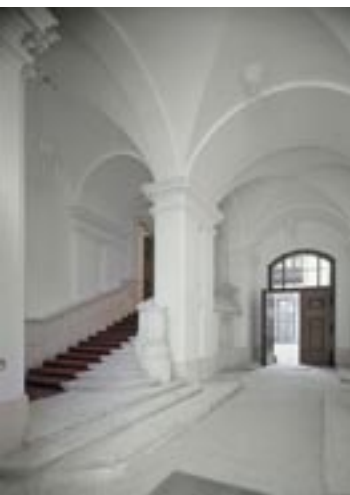
Aufwändige Revitalisierung: Reichstagspräsidentenpalais im Zentrum Berlins.

Rahmentüren mit 4 – 5 eingelegten und aufgedoppelten Füllungen in Holzfutter. Sowohl die Türen als auch die Zargenspiegel sind – dem historischen Vorbild entsprechend – stark profiliert. Die Portalkonstruktionen sind durchwegs vierflügelig ausgeführt, wobei sich jeweils zwei Flügel zum dauerhaften Offenhalten wegklappen lassen.