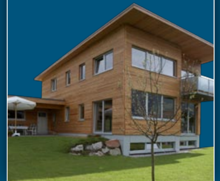
Arch. Andreas Volker, Zell am See, Ausführung Meiberger Holzbau, Lofler

In Österreich hat die Bundesregierung für die energietechnische Nachrüstung bei Althausanierungen EUR 100 Mio. bereitgestellt. Darüber hinaus gibt es hier in den Bundesländern (allenfalls auch in den Gemeinden) Förderungen in unterschiedlicher Höhe, genaue Informationen erhält man hier beim zuständigen Amt der Landesregierung/Referat für Wohnbauförderung.