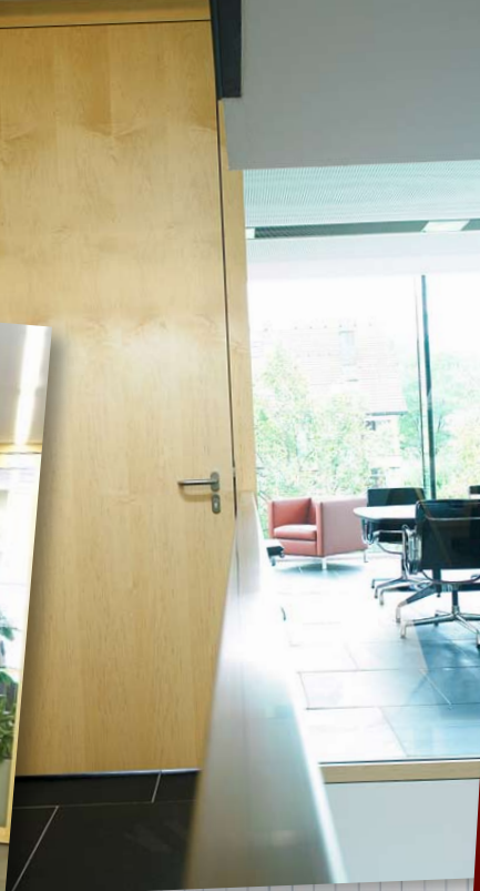
Tower der Deutschen Post, Hamburg