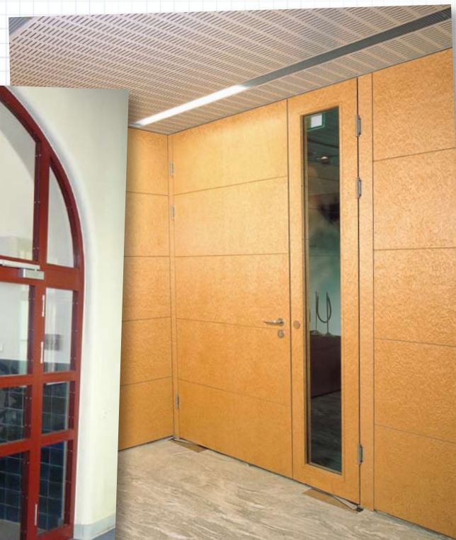
Hotel-Restaurant Kreuzwirt, Musterstadt