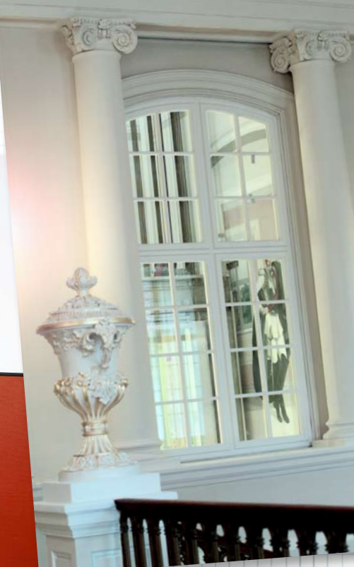
Hotel Palais Coburg, Wien