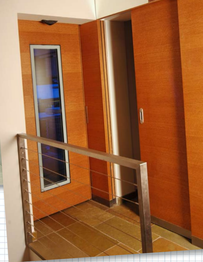
Hotel Restaurant Kreuzwirt, Musterstadt