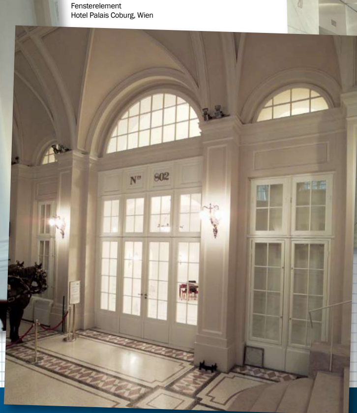
Fensterelement Hotel Palais Coburg, Wien