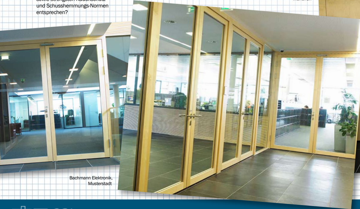
Bachmann Elektronik, Musterstadt